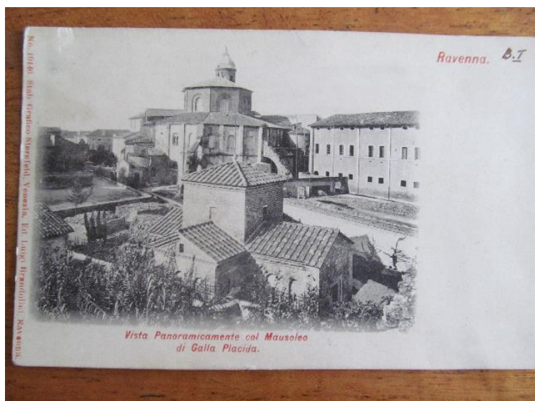
Ил. 3. Лист Федора Шміта до Павли Шпер, 15 березня 1904 р.